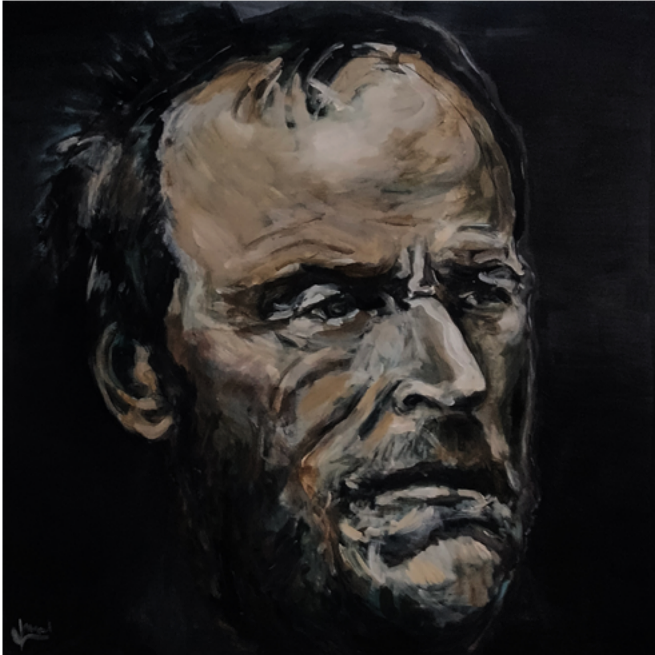
W.T. SHERMAN Acrylique sur toile, 130 cm x 130 cm, 2026