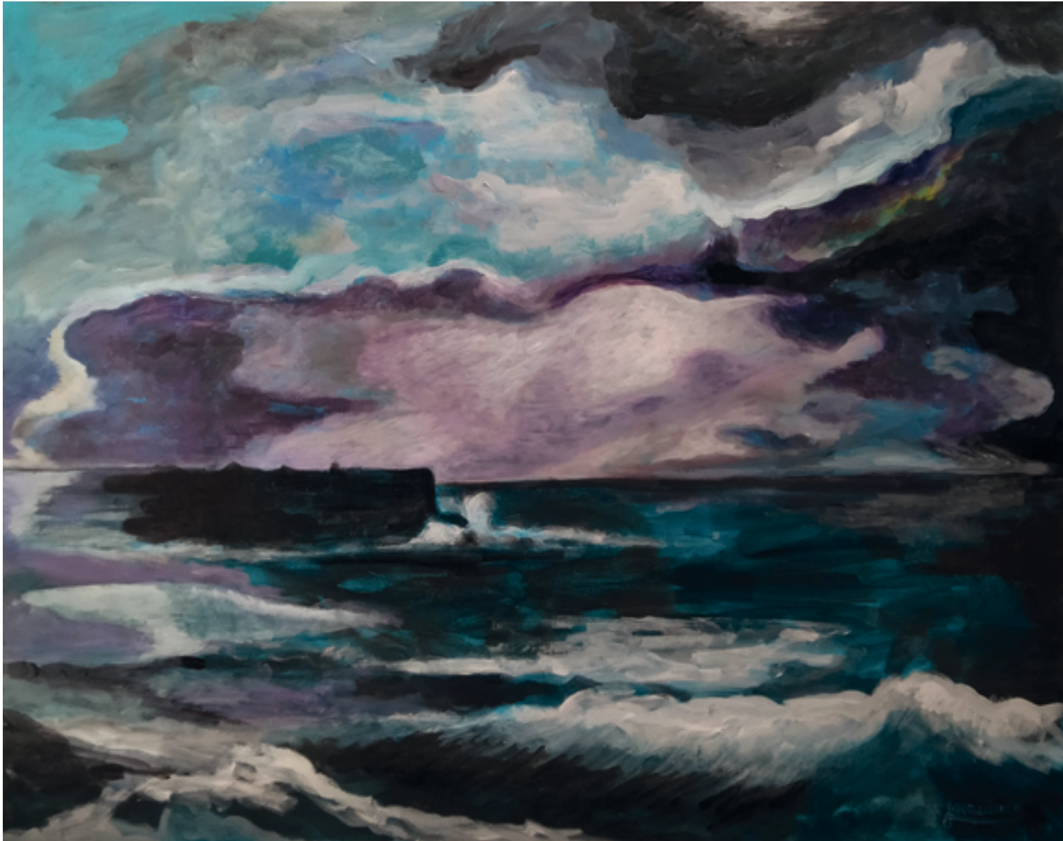
La Grande Vague

Acrylique sur toile, 162 cm x 130 cm, 2024