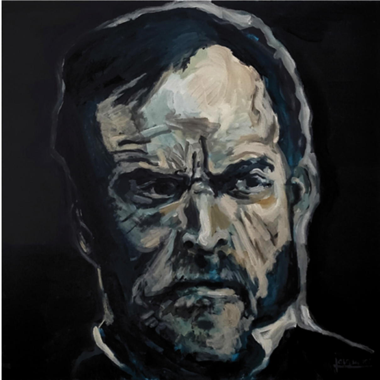
W.T. SHERMAN Acrylique sur toile, 100 cm x 100 cm, 2024