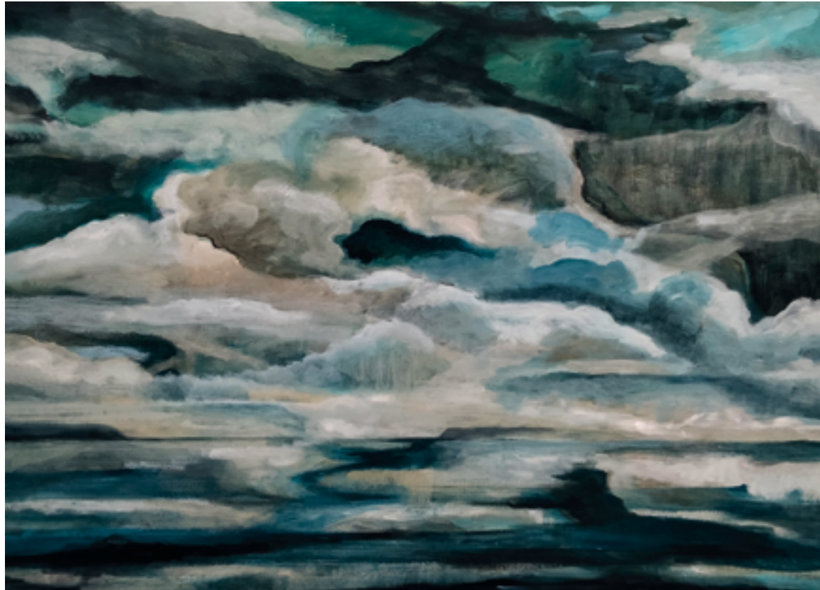
Ciel et Falaise

Acrylique sur toile, 130 cm x 89 cm, 2025