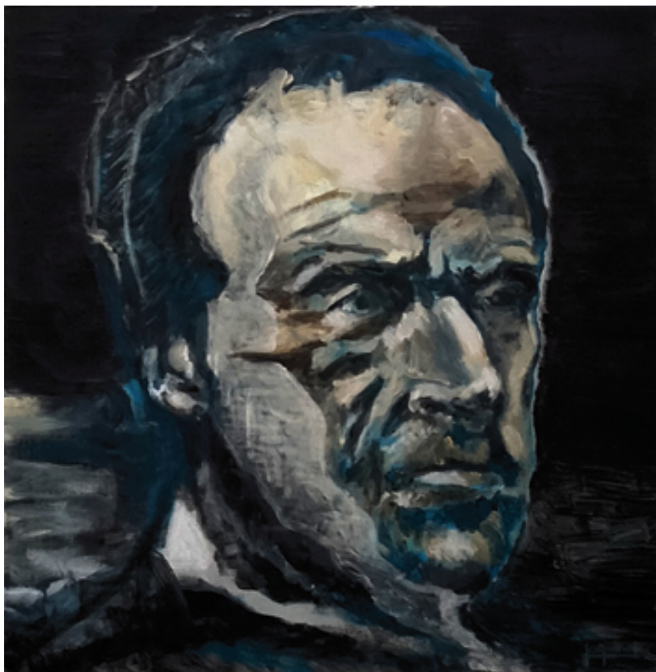
W.T. SHERMAN Acrylique sur toile, 100 cm x 100 cm, 2024