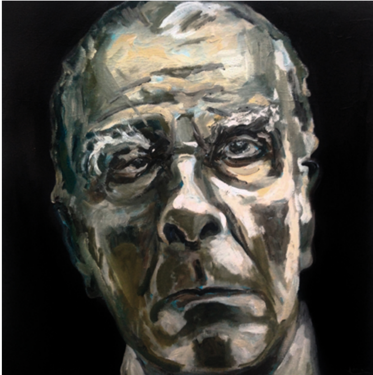
Jorge Luis BORGES

Acrylique sur toile, 100 cm x 100 cm, 2025