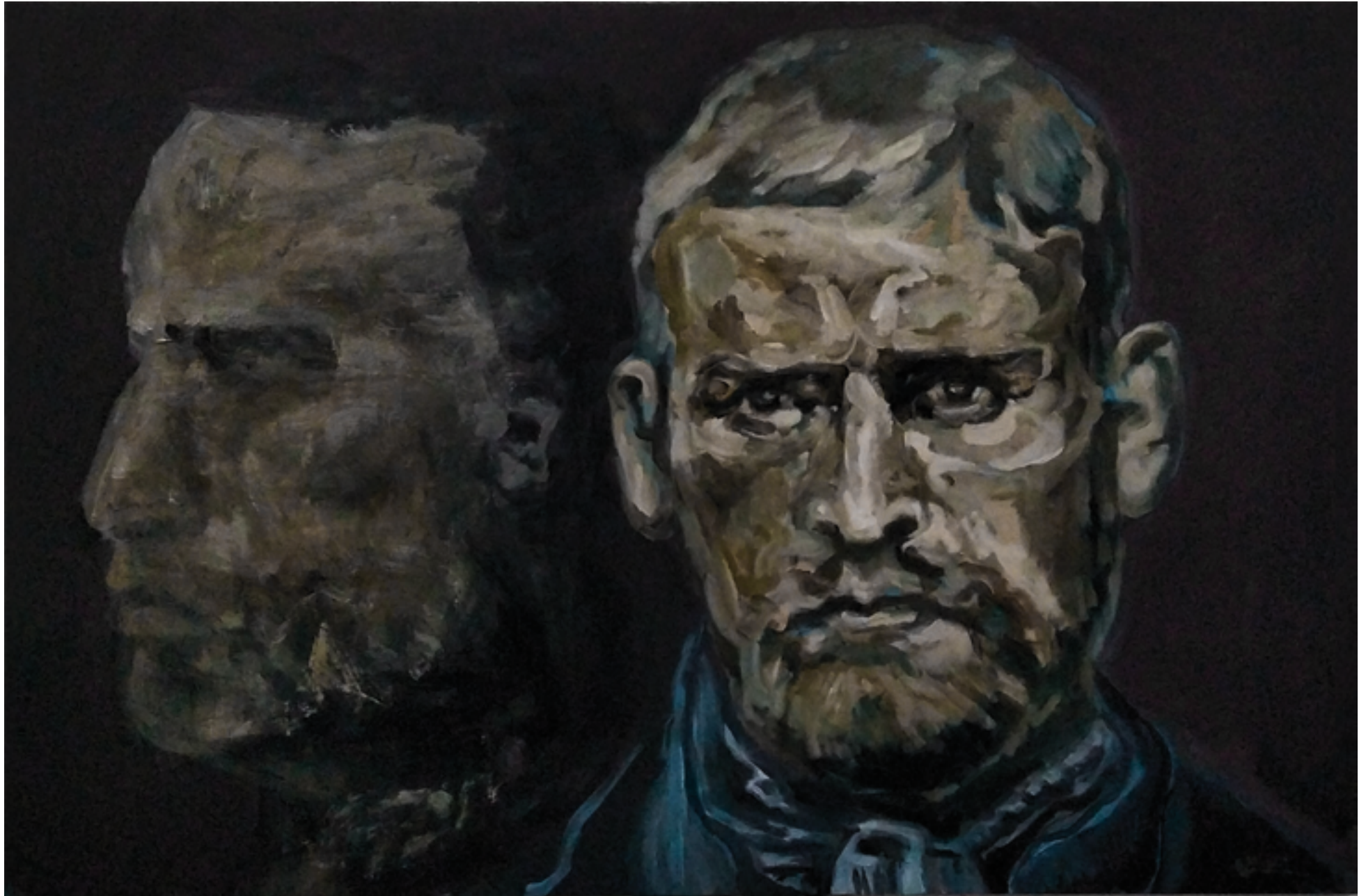
Oliver Hill Acrylique sur toile, 195 cm x 114 cm, 2025