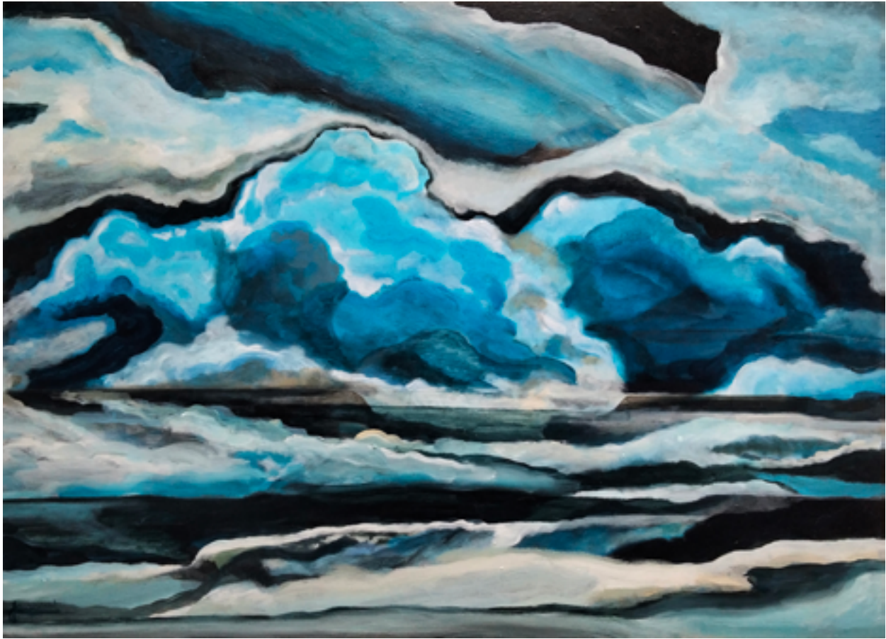
Face à la rade de Brest

Acrylique sur toile, 130 cm x 89 cm, 2025