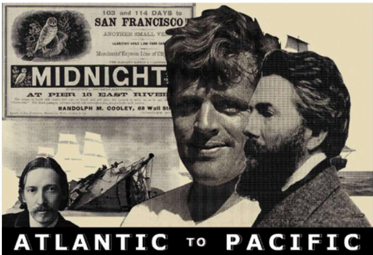
«Atlantic to Pacific» sérigraphie 100cm x 70 cm

Ces dernières années, j'ai beaucoup voyagé et accompli un rêve d'enfance...traverser l'océan Atlantique et rejoindre les Antilles, découvrir la Polynésie et visiter Tahiti. Ces rêves sont pour beaucoup à la lecture des romanciers du 19 ème et à leurs adaptations au cinéma mais surtout à la pratique de la voile, en croisière ou en régate, sur un quillard comme sur un Vaurien, la mer m'a toujours inspiré.