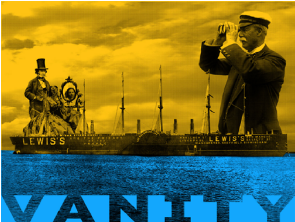
« The Great Eastern Vanity » sérigraphie 100 cm x 70 cm