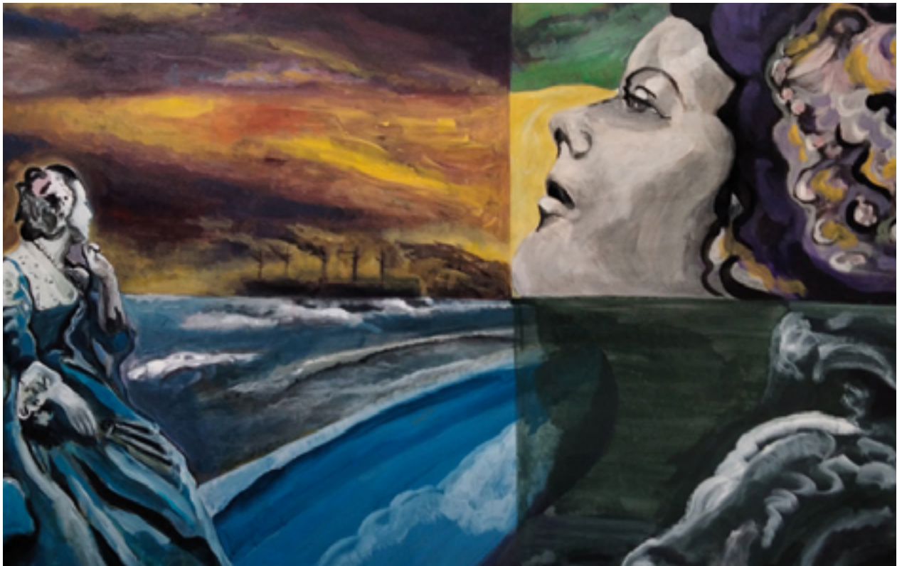
«Madame rêve» peinture sur toile 130 cm x 198 cm