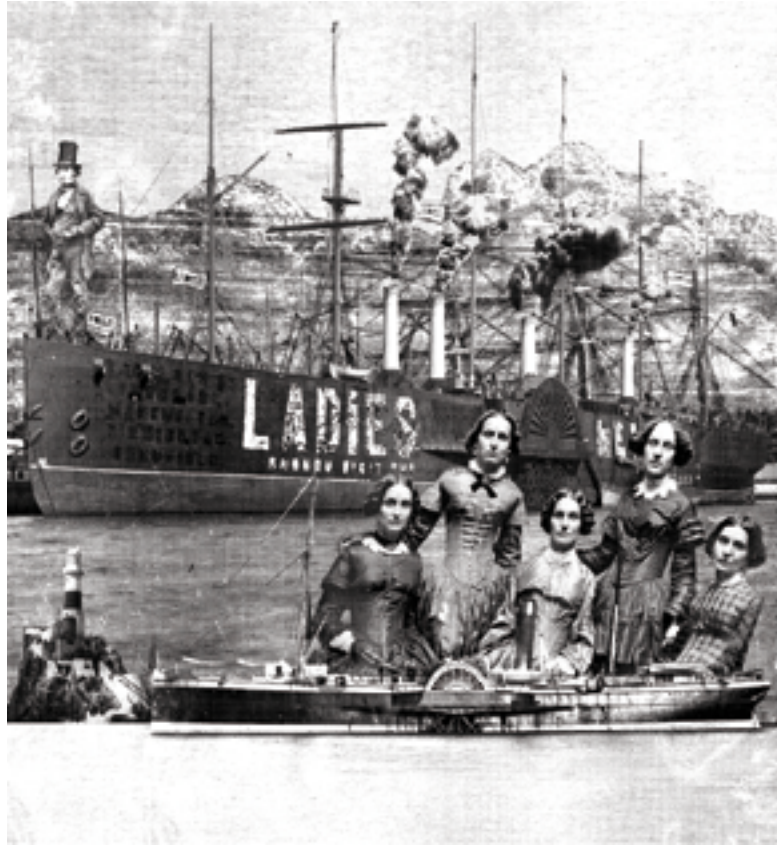
« Ladies should visit » sérigraphie 70 cm x 100 cm