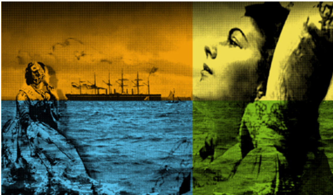
« madame rêve » sérigraphie 100 cm x 70 cm